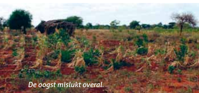
De oogst mislukt overal.