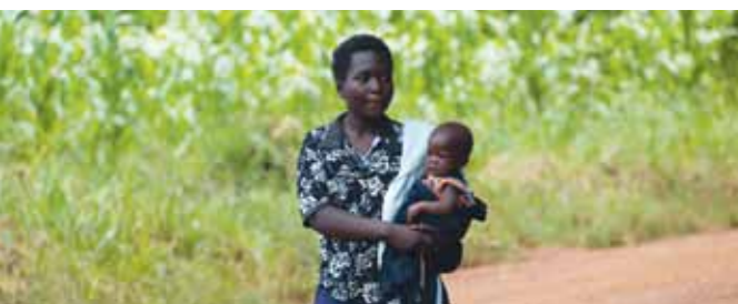
Deze moeder moest kilometers lopen om haar kind voor behandeling naar de kliniek te brengen.

*Bron: United Nations Development Programme and World Health Organisation