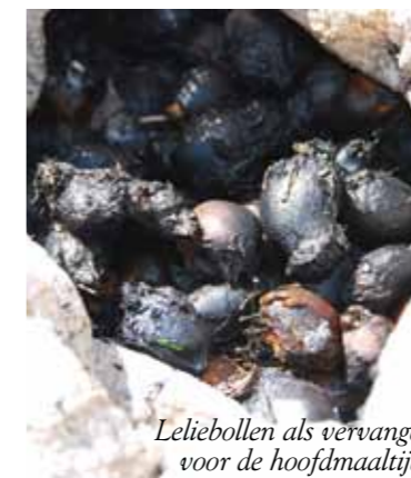
Leliebollen als vervanger voor de hoofdmaaltijd.