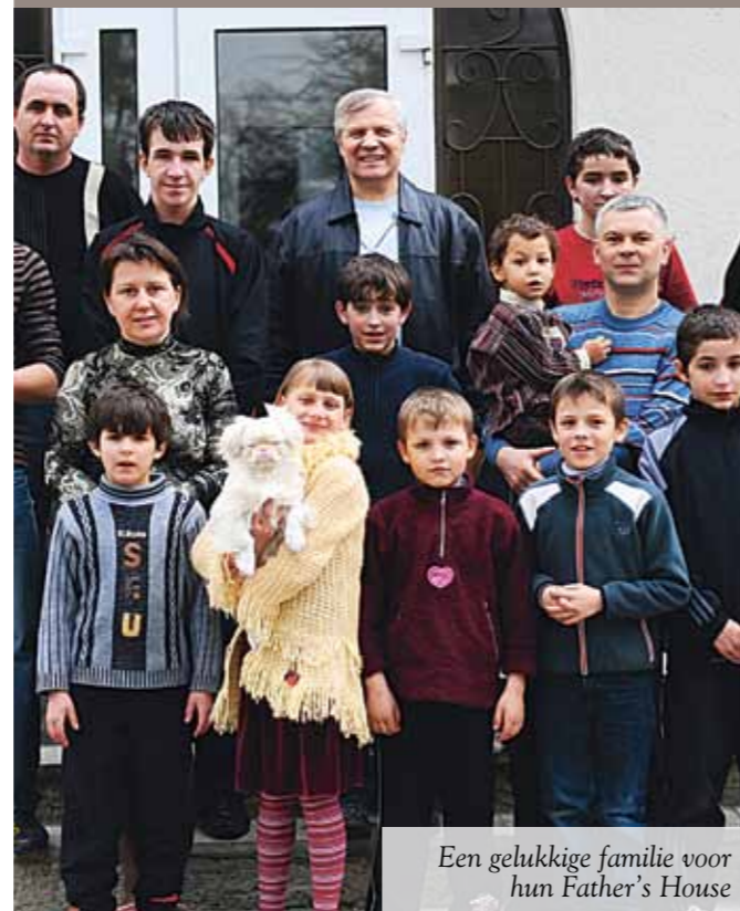
Een gelukkige familie voor hun Father's House

EEN NIEUW HUIS OM 11 STRAATKINDEREN TE VERWELKOMEN IN EEN ZORGZAME FAMILIE-OMGEVING